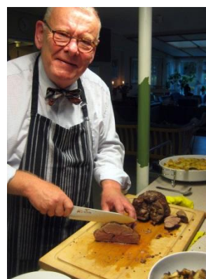
Klaus forkæler os