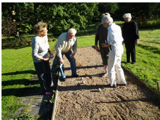
Petanquebanen i brug