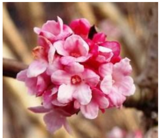
Forårsbebuder på Storedam primo marts 2014